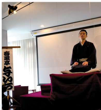
勉強会『よいちんち』

本人の「日に日に師匠が好きになる」という言葉を聞いて安心したようです。 一お父さんの「けいろう落としていたが」 本社(オールスパイス)を移転してきました。地域の交流スペースにも使いたかったので、せっかくの機会なので今回勉強会の会場としました。 親子の壮大な道楽です。 ずうっとスネをかじってもらえるようにさらに太いすねになるように頑張っています。 質問者の方をまっすぐに見つめて質問に答えてくれた与いちさんとそれをニコニコとみているお父さんの笑顔がとても印象的で、ざーっと笑いに包まれた楽しい1時間でした。これからの二人の益々のご活躍が楽しみです。