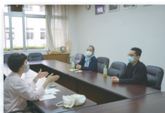
楽しくお話を伺いました